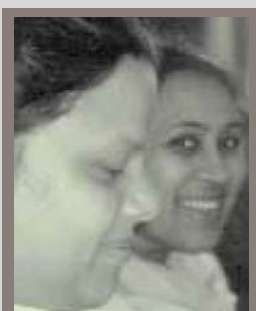
زنان داوطلب در پروژه بازآفرینی

اگر زنان، مستمری‌بگیر، بیکار، پاکستانی یا بنگلادشی، سرپرست خانوار یا مستأجر باشند، احتمالاً فقیرتر از مردانی با همین مشخصات مشابه هستند. آن‌ها همچنین، در تصمیم‌گیری‌هایی مربوط به زندگی خودشان نیز در نظر گرفته نمی‌شوند. پروژه‌های زیر نشان می‌دهد که چگونه مشارکت زنان می‌تواند تفاوت بزرگی در این زمینه ایجاد کند. گلیدیگ ۲ یک منطقه در شهر مؤثر تیدفیل ۳ در کشور ولز است. این منطقه بالاترین شاخص محرومیت در این کشور را به خود اختصاص داده است. در سال ۱۹۹۸، شش زن محلی گرد هم آمده و بنیاد «گلیدیگ» را تشکیل دادند. این بنیاد با کمک موسسه آکسفام ۴ پرسش‌های بنیادی از ۳۵ هزار مردمی که در این منطقه محروم زندگی می‌کردند را آغاز نمود. آیا زنان و مردان فقر را به‌صورت متفاوت تجربه کرده‌اند؟ چگونه می‌توان آن‌ها را در بهبود وضعیت خود درگیر نمود؟ چه اتفاقی باید صورت گیرد تا تغییر رخ دهد؟ مصاحبه‌ها به نیازهای مختلف مردان و زنان توجه نمود و مسائل مربوط به آموزش و اشتغال، مراقبت از کودکان، روزمرگی، اعتمادبه‌نفس پایین و انتظارات کم را مورد بررسی قرار دادند. تجزیه‌وتحلیل جنسیتی متمرکز شد بر روی اینکه چگونه زنان و مردان، پیر و جوان، به‌صورت متفاوتی با موقعیت‌های متفاوت خود مواجه می‌شوند. بنیاد، توصیه‌های خود را برای تغییر در سطوح محلی، منطقه‌ای و ملی ارائه داد، همچنین برای حل برخی از این مشکلات با موفقیت از کمک صندوق اروپا استفاده